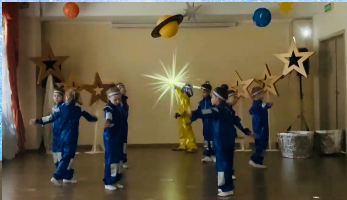
Танец «Юный космонавт»