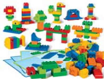
45019 Кирпичики DUPLO® для творческих занятий