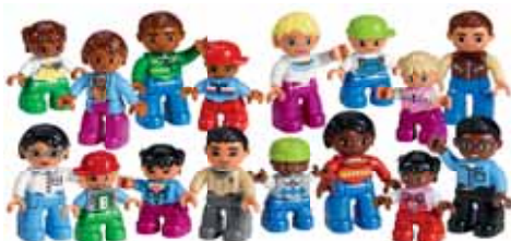
45011 Люди мира DUPLO