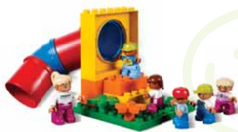
45001 Детская площадка