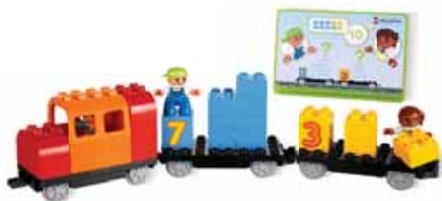
45008 Математический поезд