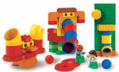
9076 Набор с трубками